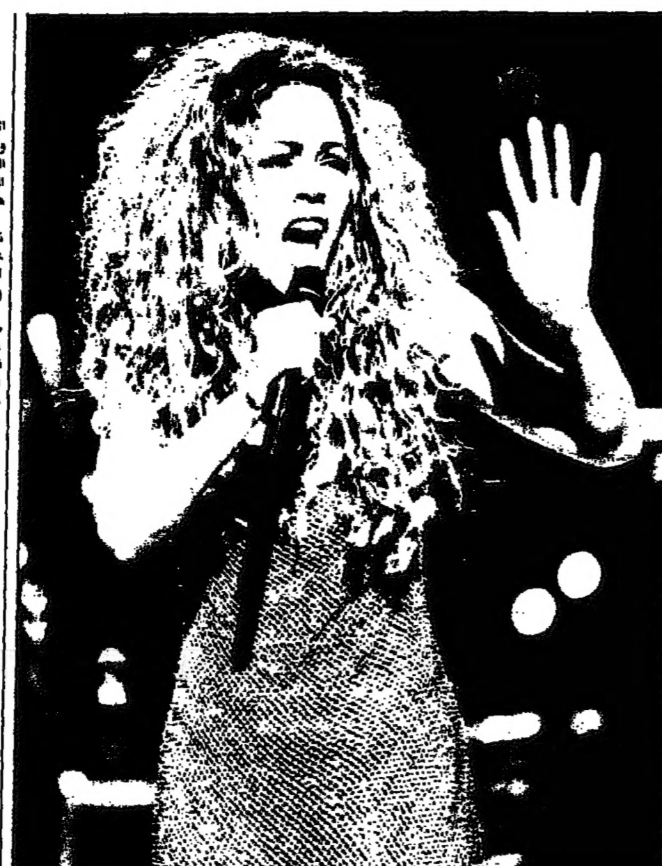
نجمة اليرب الأمريكية ماريا كاري تعفي في حفل من نيويورك أسس الأول لصالح حملة 'الغدا الموسيقي' التي تستهدف تحسين مستوى التعليم الموسيقي في مدارس أمريكا

واشنطن - أ. ب. كشف تقرير صادر عن منظمة الصحة العالمية عن أن أكثر من 100 ألف أمريكي يموتون سنوياً بسبب الأدوية. وقال التقرير إن الأدوية تسبب 10 في المئة من إجمالي الوفيات في الولايات المتحدة، وهو رقم أعلى من نسبة الوفيات بسبب السرطان. وأشار التقرير إلى أن الأدوية تسبب 10 في المئة من إجمالي الوفيات في الولايات المتحدة، وهو رقم أعلى من نسبة الوفيات بسبب السرطان. وأشار التقرير إلى أن الأدوية تسبب 10 في المئة من إجمالي الوفيات في الولايات المتحدة، وهو رقم أعلى من نسبة الوفيات بسبب السرطان.